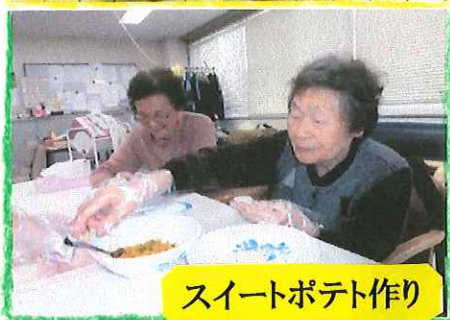
スイートポテト作り