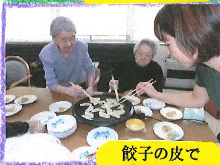
餃子の皮で かぼちゃパイ作り