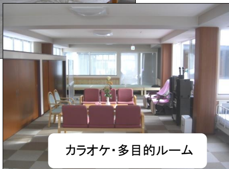
カラオケ・多目的ルーム

施設はモダンなデザインの2階建です。 当法人スタッフは施設やデイサービスなどでの経験が豊富で、さまざまな活動をしており、理想のサービスを心掛けて活動中です。