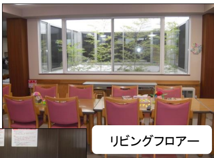
リビングフロアー

施設はモダンなデザインの2階建です。 当法人スタッフは施設やデイサービスなどでの経験が豊富で、さまざまな活動をしており、理想のサービスを心掛けて活動中です。